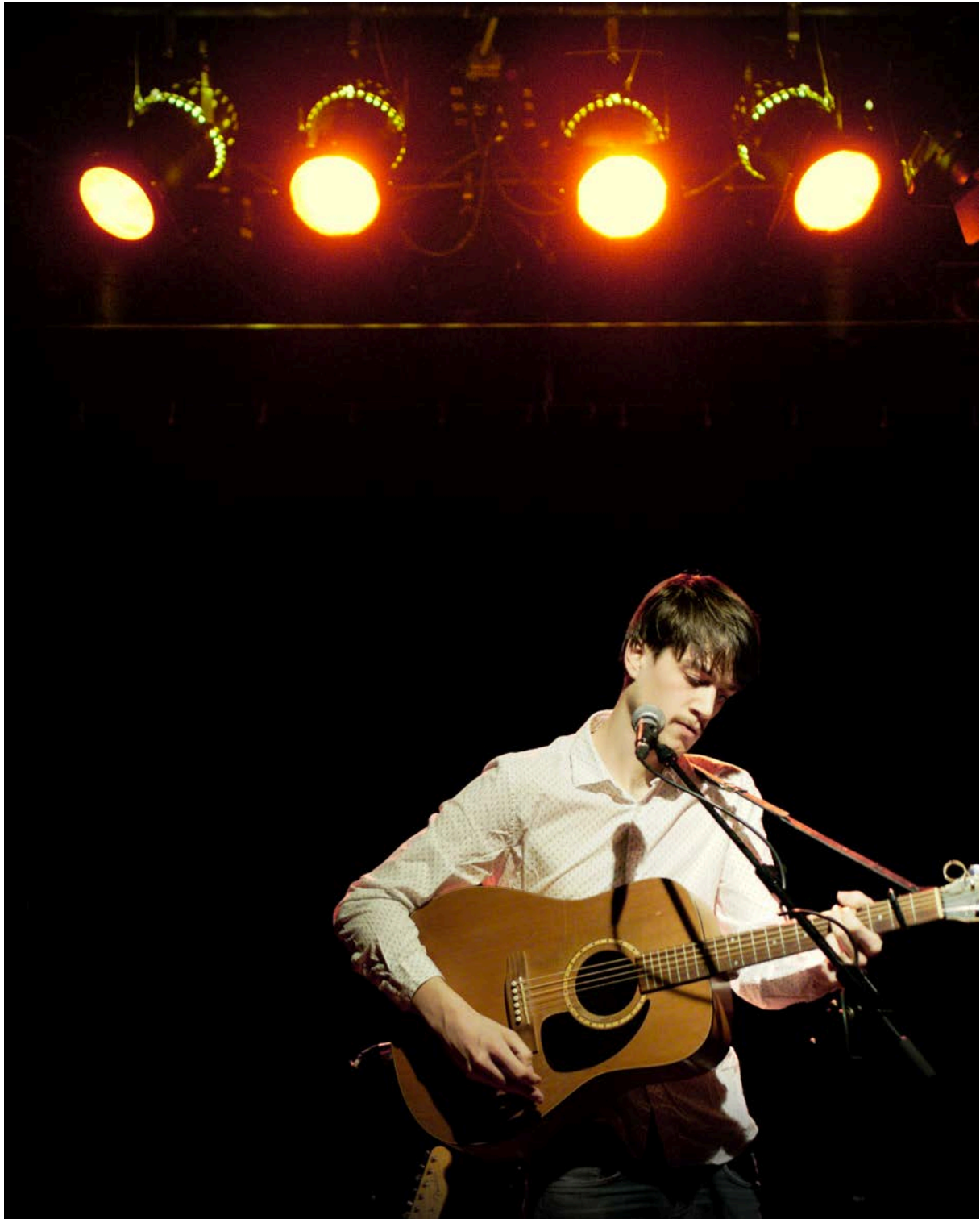
Long Tall Jefferson springt am Freitag, 24. August, um 20.30 Uhr auf der glernerSachbühne für Hedgehog ein.